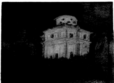
"La Zizzola notturna"/Bra Bassorilievo su legno cm. 40 x 60 – 2001

Arrivarci di sabato pomeriggio e con calma, entrando nella splendida chiesa sconsecrata di S. Iffredo proprio quando è rimasto solo il curatore della mostra, e perdere gli occhi "nei colori del legno" che Giovanni Prato sa far vivere, "...libero da scuole accademiche ma esperto di tecniche antiche" e seguire le modulazioni del legno che diventa scorcio architettonico, collina, vigneto, vedute scomparse come le fabbriche, è un'esperienza che non avevo ancora provato.